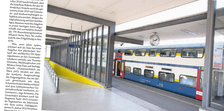
Reisen mit Tageskarten ist beliebt. Ob die Bevölkerung vergünstigte ÖV-Tickets auch nach Ende 2023 erhält, ist in vielen Limmattaler Gemeinden noch unklar.

Das Angebot soll ab 2024 durch Spartickets ersetzt werden. Limmattaler Gemeinden befürchten, dadurch zu SBB-Schaltern zu werden.