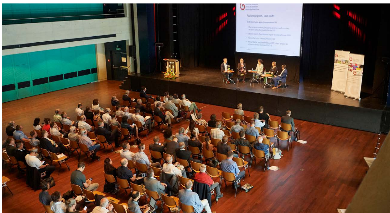
Des représentantes et représentants de communes membres de l'ACS suivent la table ronde sur les chances et les défis de l'administration numérique.

La prochaine Assemblée générale de l'ACS est fixée au 8 juin 2023. Elle aura lieu dans le cadre des salons Suisse Public et Suisse Public SMART sur le site de Bernexpo à Berne et sera consacrée au problème de la pénurie de personnel qualifié dans les administrations communales.