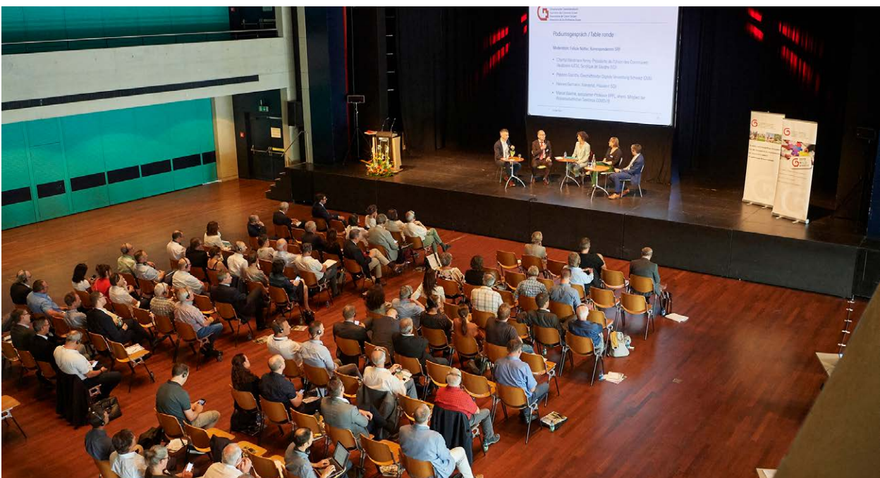
Vertreterinnen und Vertreter von SGV-Mitgliedergemeinden verfolgen das Podiumsgespräch zu den Chancen und Herausforderungen der digitalen Verwaltung.

Die nächste Generalversammlung des SGV ist auf den 8. Juni 2023 angesetzt. Sie findet im Rahmen der Fachmesse Suisse Public und Suisse Public SMART auf dem Gelände der Bernexpo in Bern statt und wird sich dem Problem des Fachkräftemangels in den Gemeindeverwaltungen widmen.